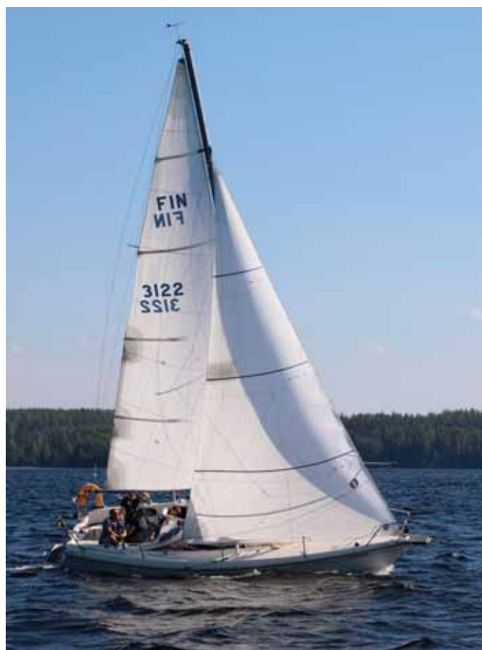
Teksti ja kuvat: Paavo Nikkilä

Rata-alueen syvyys aiheutti tavanomaiseen tapaan haasteita poijujen ankkuroinnille. Yläpoijun ankkurointisyvyys oli noin 45 metriä ja alapoijullakin vettä oli nelisenkymmentä metriä. Levittäjäpoiju vietiin tarkoituksella sen verran kauemmas, että se saatiin ankkuroitua "vain" 20 metrin syvyyteen. muuten olisivat ankkuriköydet loppuneet kesken.